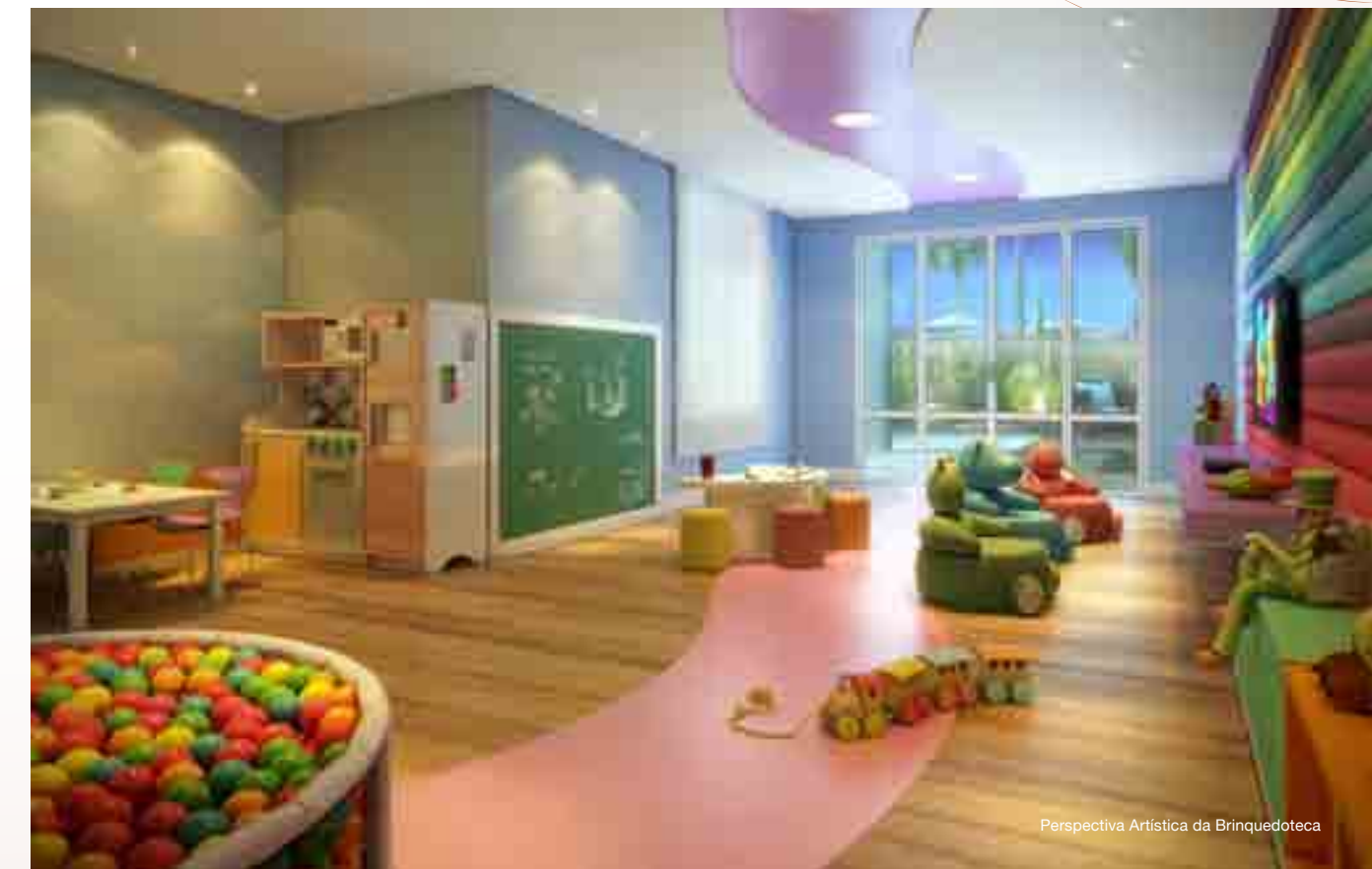
Perspectiva Artística da Brinquedoteca

Criança precisa de espaço para brincar, criar, conhecer e crescer. Nos espaços destinados aos pequenos, dá para sentir a verdadeira arte de ser criança.