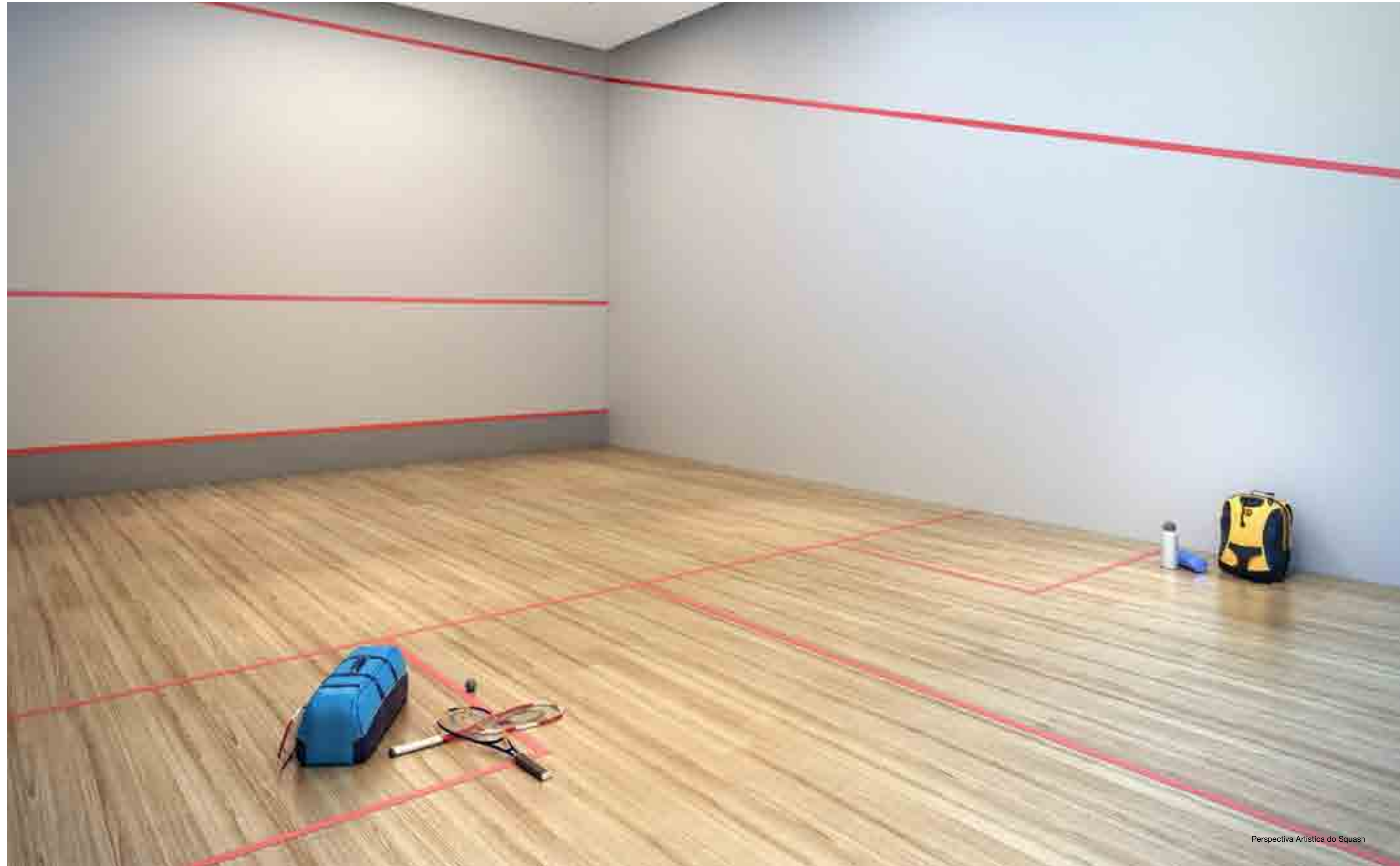
Perspectiva Artística do Squash