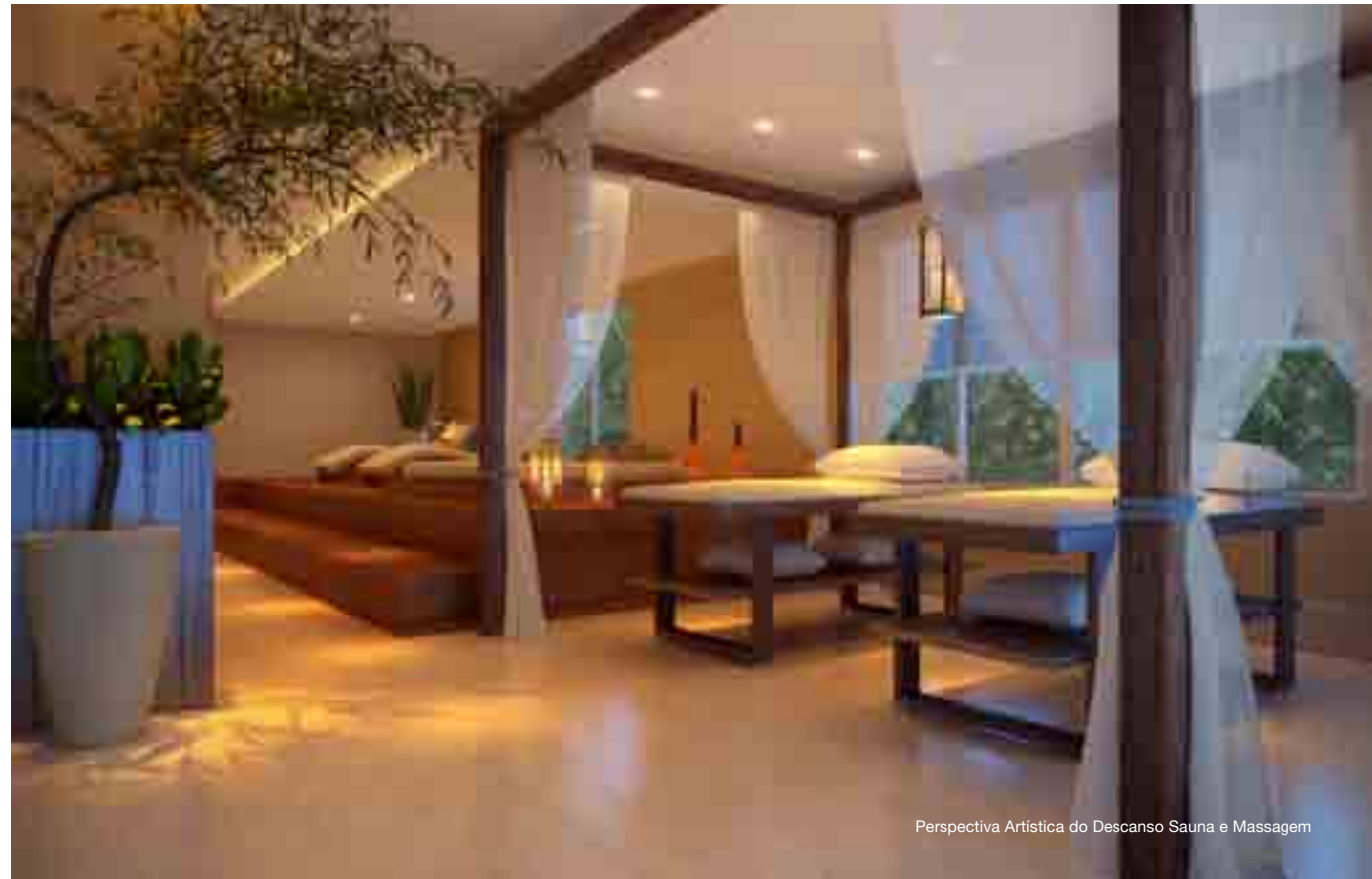
Perspectiva Artística do Descanso Sauna e Massagem