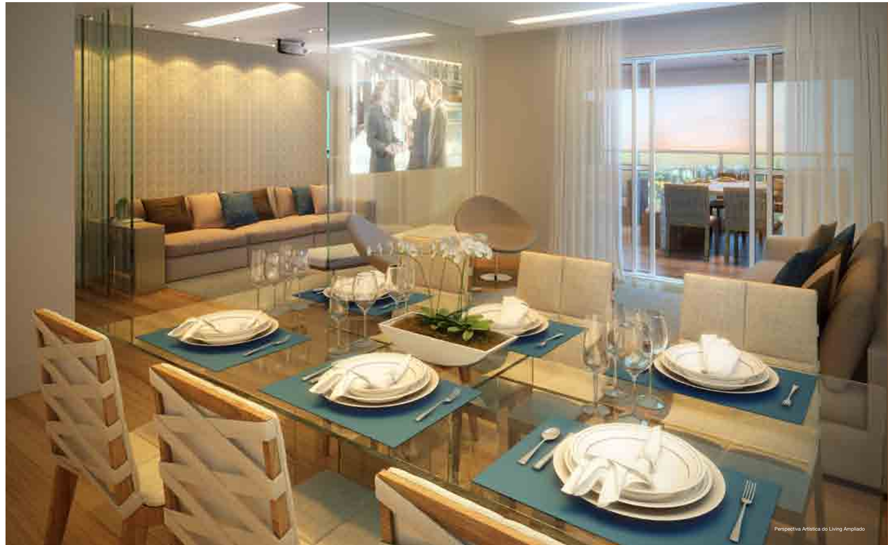
Perspectiva Artística do Living Ampliado