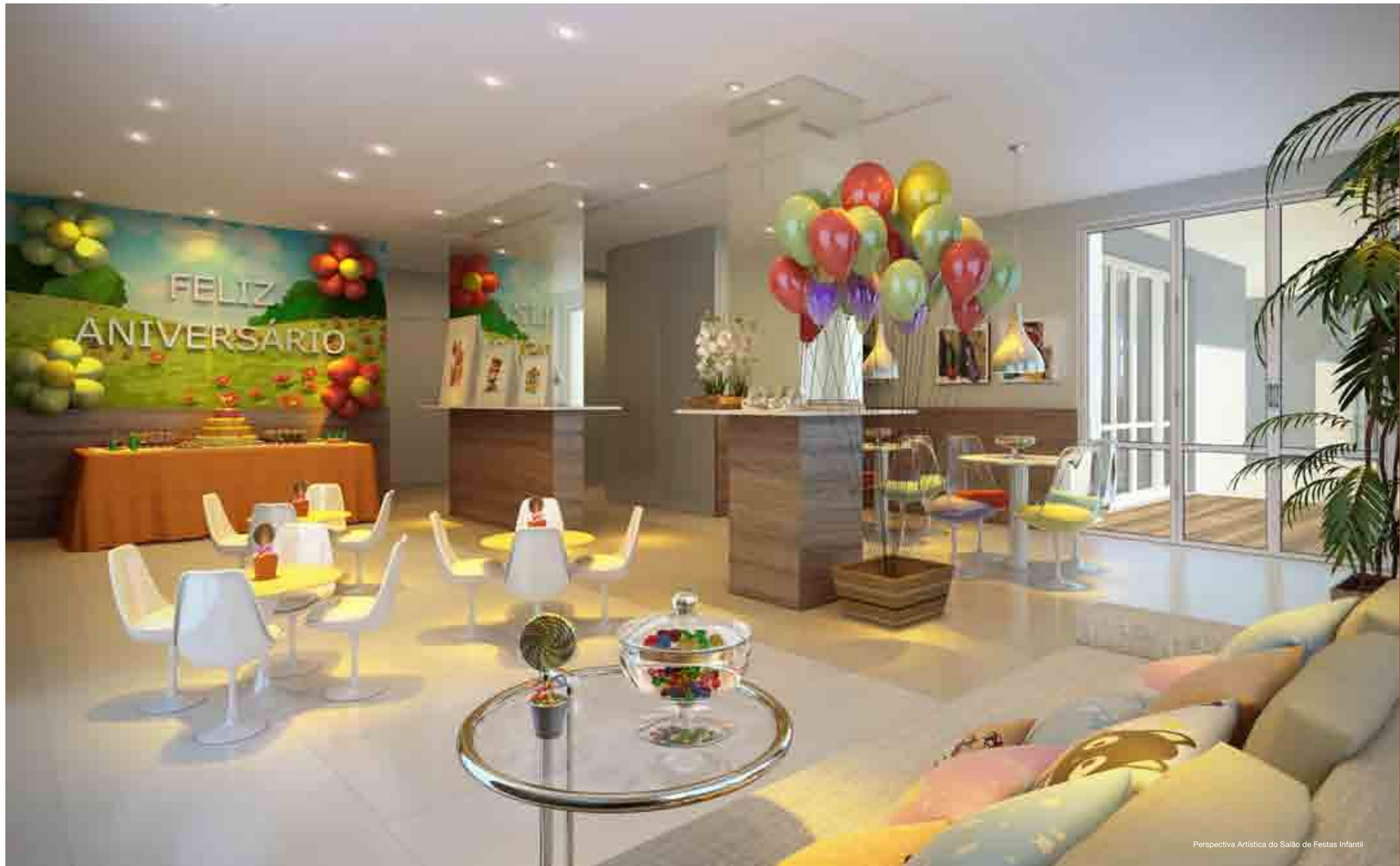
Perspectiva Artística do Salão de Festas Infantil