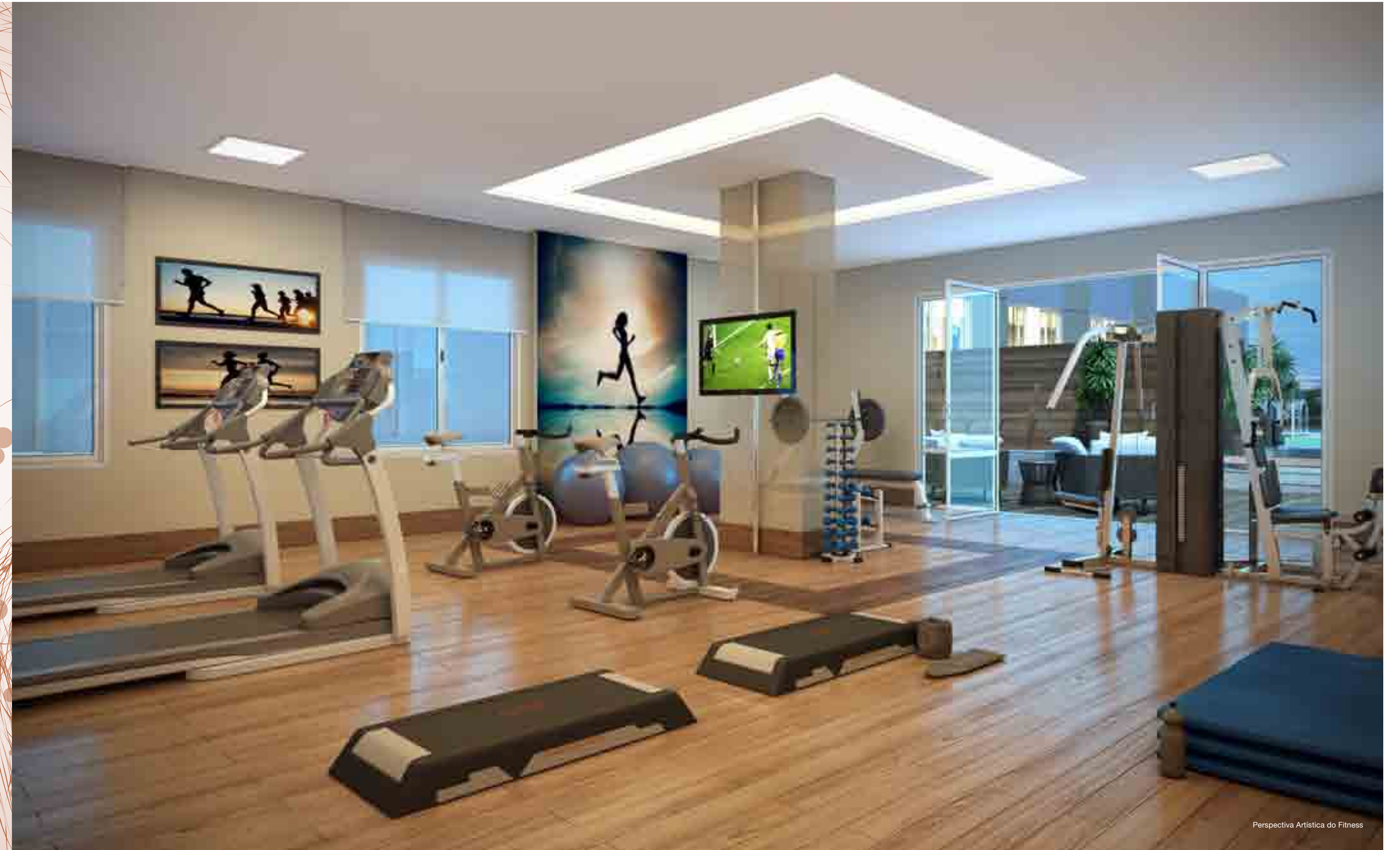
Perspectiva Artística do Fitness

Todos os cuidados que você precisa para relaxar e cuidar da saúde. São diversos espaços destinados ao bem-estar de toda sua família.