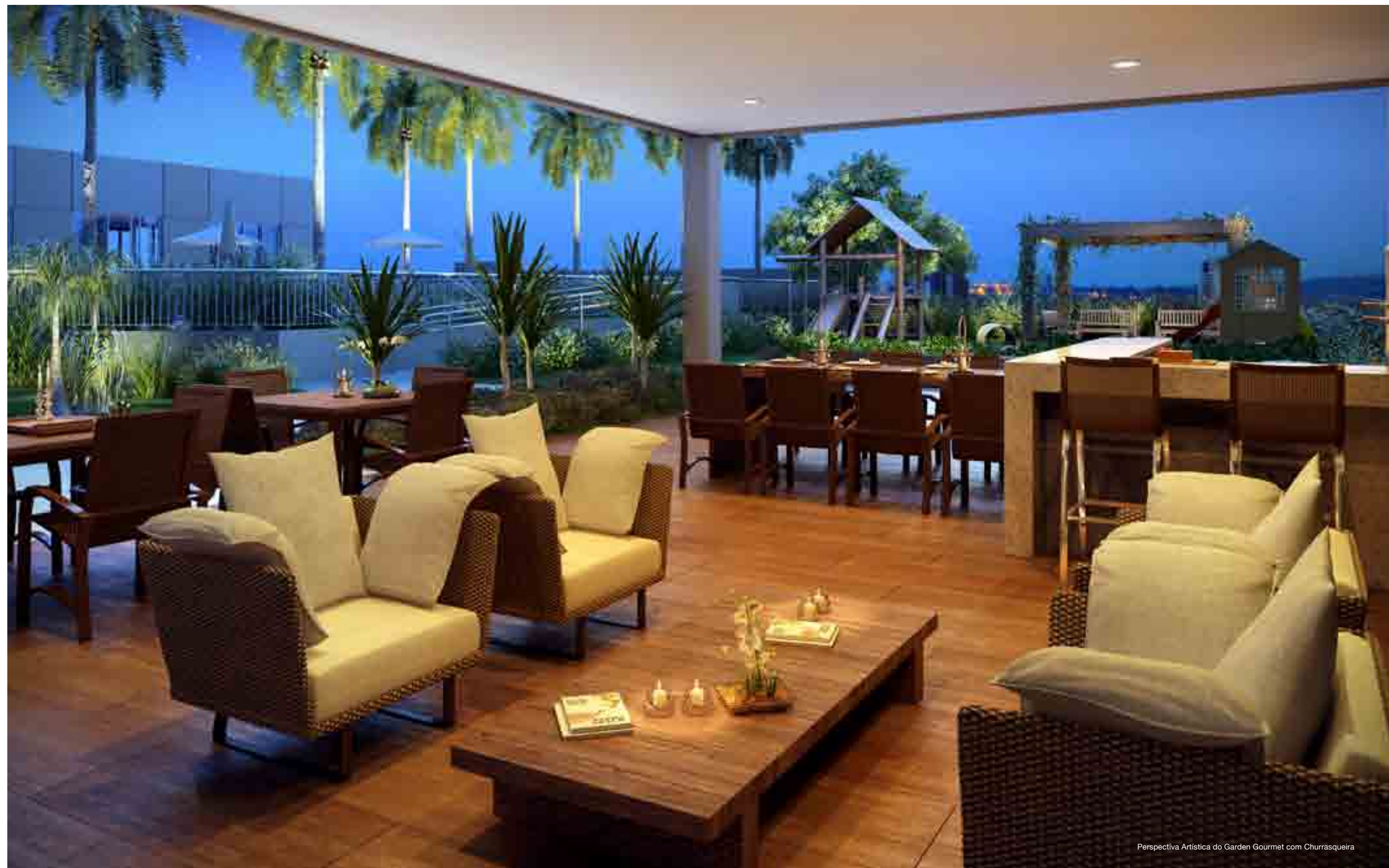
Perspectiva Artística do Garden Gourmet com Churrasqueira