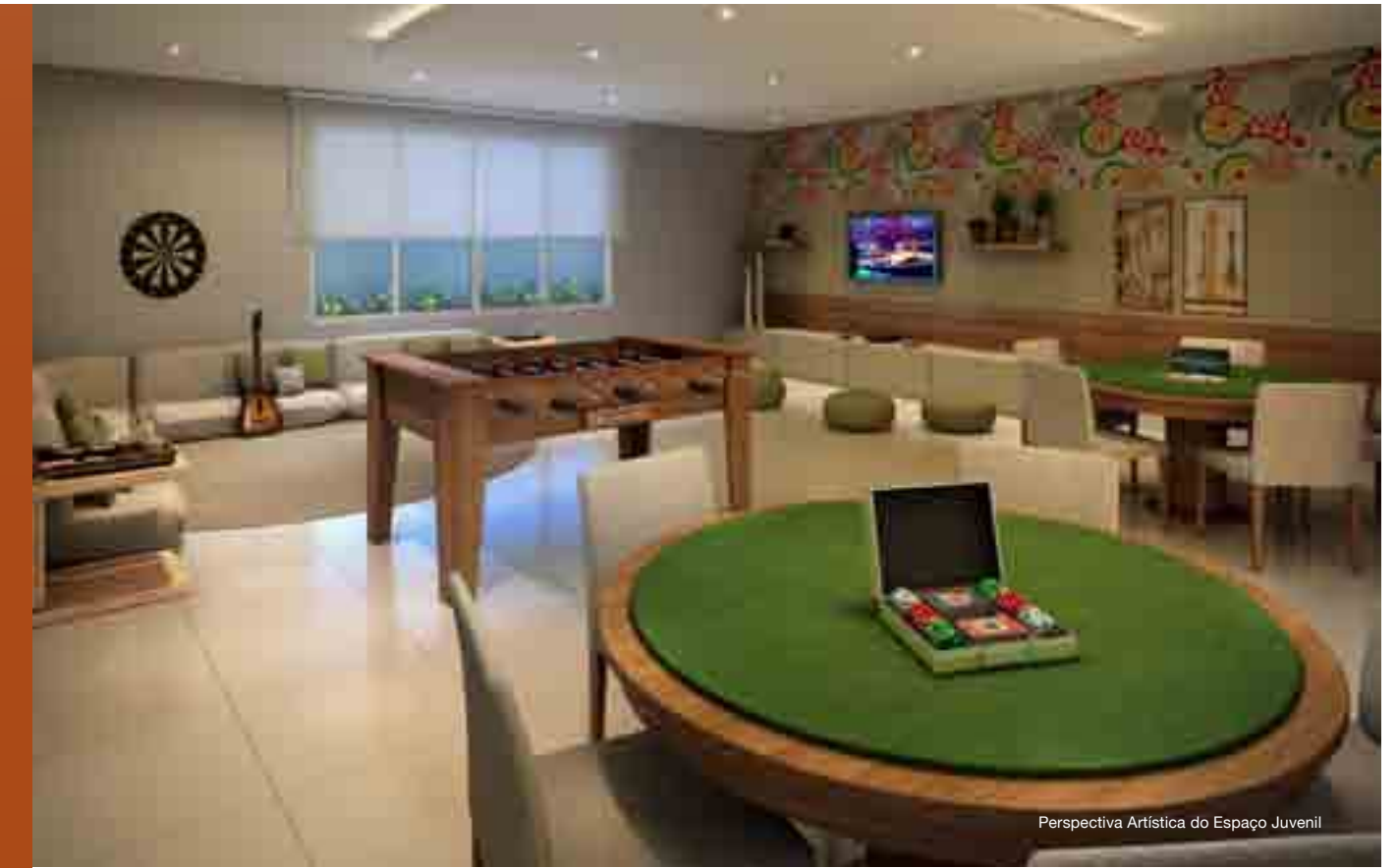
Perspectiva Artística do Espaço Juvenil