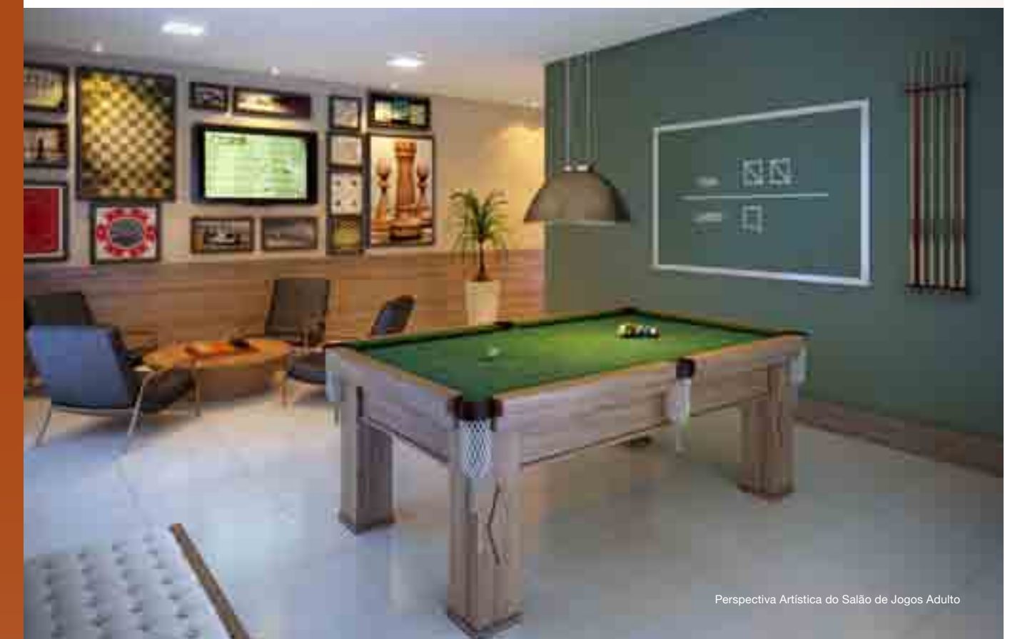
Perspectiva Artística do Salão de Jogos Adulto