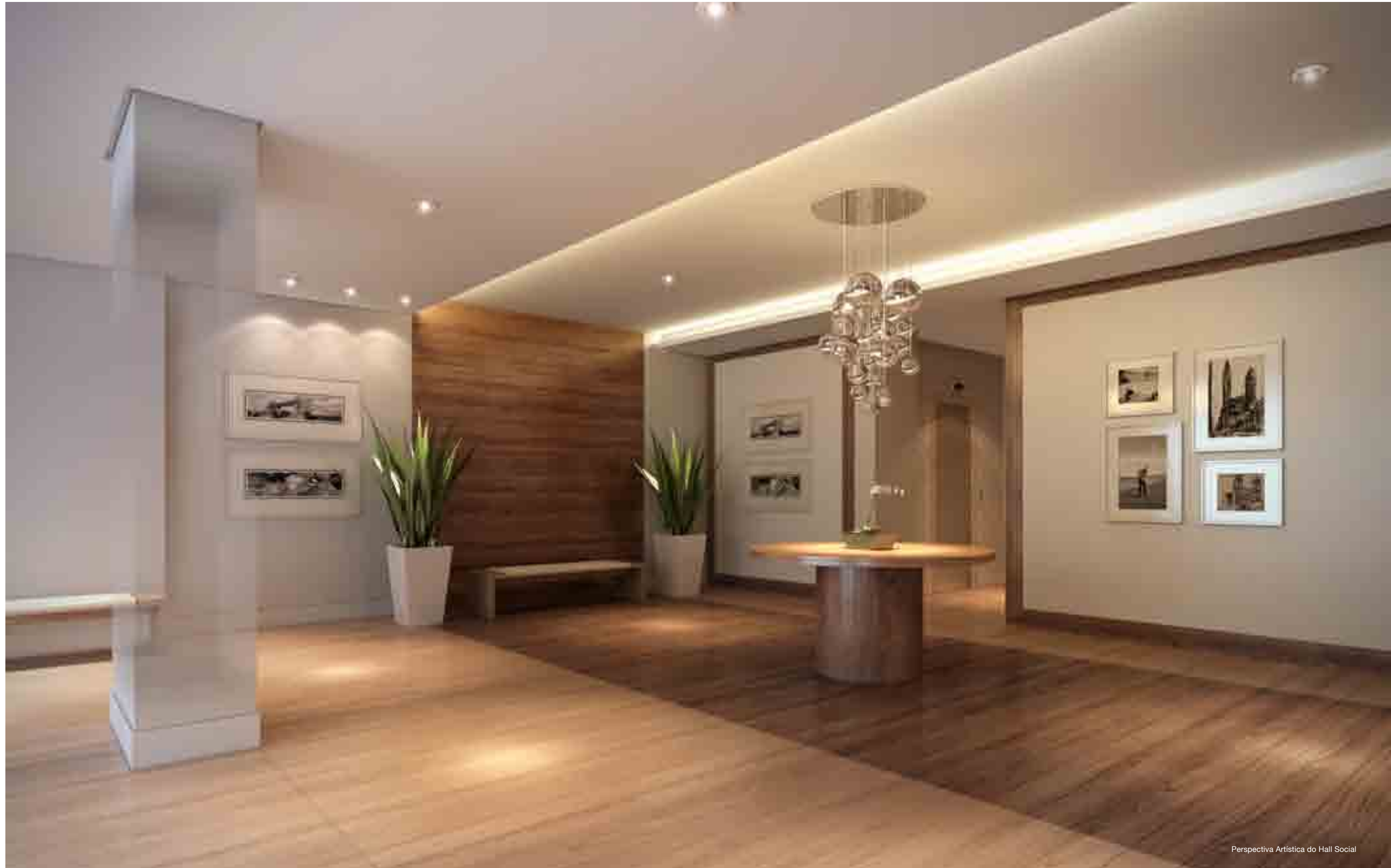
Perspectiva Artística do Hall Social