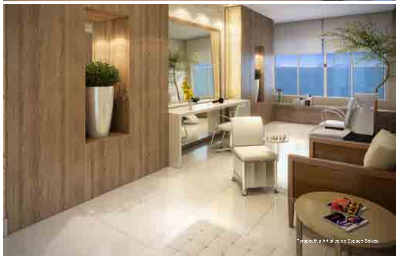
Perspectiva Artística do Espaço Beleza